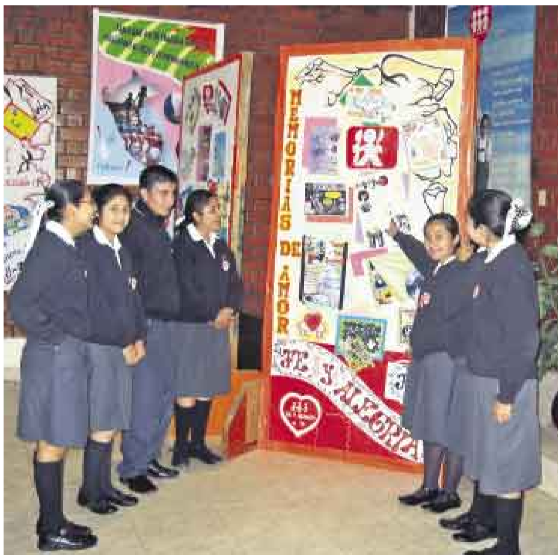
ESPERANZA. Los estudiantes del colegio Fe y Alegría N° 13 muestran orgullosos su mensaje de paz.