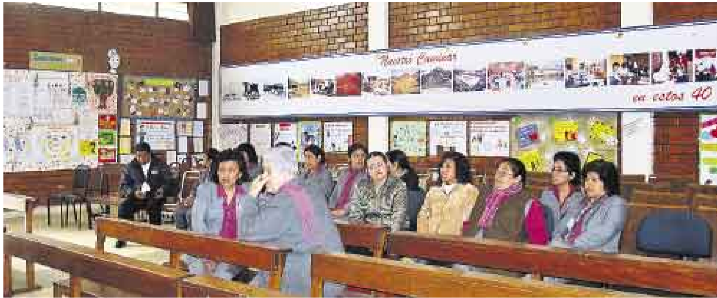
EJEMPLO. La plana docente del colegio Fe y Alegría N° 13 comandó la investigación de sus alumnos sobre lo que dejó la violencia en la comunidad.

Ellos habían realizado una exposición de sus trabajos denominada “Memorias cargadas de amor”.