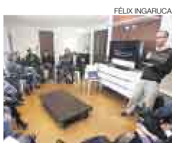
COHERENCIA. Los felicitan por su afán político y pedagógico.

El trabajo realizado por el espacio político pedagógico integrado por Proyecto Coherencia y Gobierno Coherente, denominado Coherencia, reconforta y permite tener esperanza en la juventud, en su relación con la política y la democracia. Llevar a la práctica la relación del amor por el país y la política nacional es contribuir con la recuperación de valores apartados de esta actividad durante los últimos tiempos. Coherencia no se queda solo en las ideas y opiniones, va más allá con sus exposiciones, publicaciones y reflexiones grupales. Ojalá otros