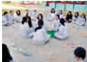
Taller "Cultura de Silencio"