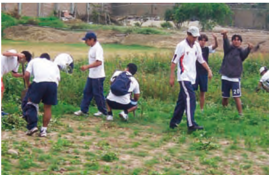
Creación de áreas verdes