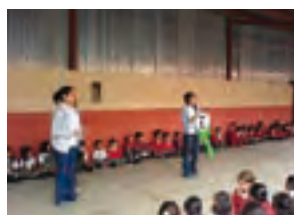
Proyecto „Educación Vial"