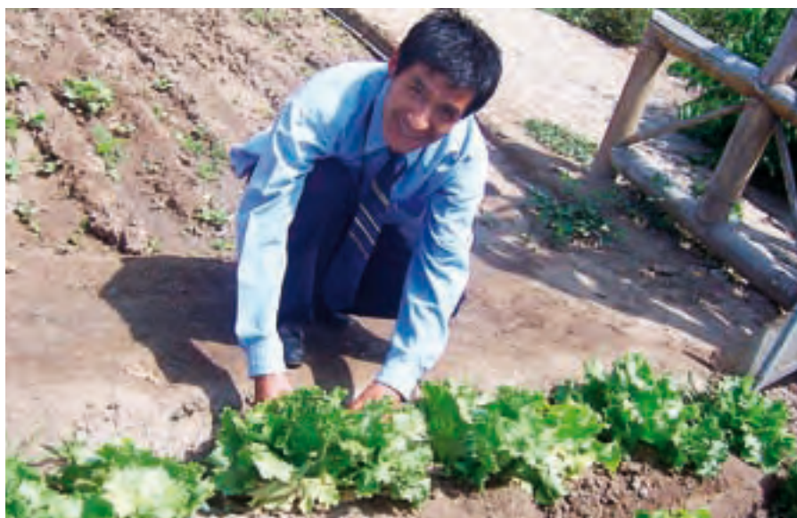
Trabajo en el permahuerto