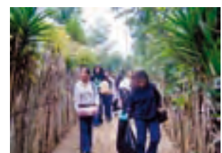
Proyecto "Cubriendo Necesidades"

Además se realizaron las siguientes actividades fuera de la Escuela: