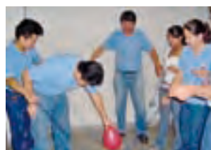
San Juan Sacatepequez