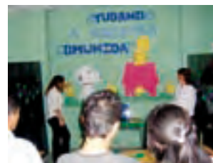
Feria de presentación de proyectos