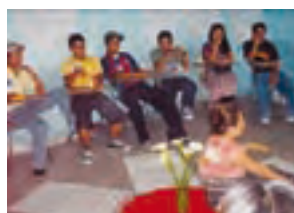
San Pedro la Laguna