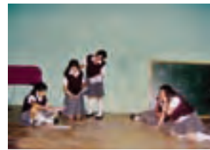
“Una oportunidad para Todos” (Lucero)

Las estudiantes diseñaron propuestas propias para proyectos con proyección social en el ámbito ciudadano, aplicando la metodología del trabajo en equipo. Asimismo se utilizó la estrategia del “Espacio Abierto”, un método de intercambio y trabajo auto-organizado. También se realizó un taller de “Mediación de conflictos”. Para compartir los resultados las estudiantes crearon una