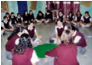
Taller "Cultura de Silencio"