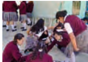
Taller "Quien es el otro"